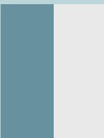
1/2 vertical 9.8 x 275 cm

* Todas las medidas están en centímetros. Para páginas dobles, tomar en cuenta el lomo para evitar que las palabras se corten. Editorial Mapas no se responsabilizará por las variantes de color y texto en materiales que no vengán acompañados de cromalín.