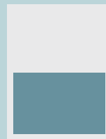
1/2 horizontal a caja 17.7 x 11.7 cm