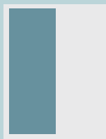
1/2 vertical a caja 8.4 x 24.5 cm