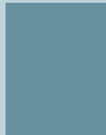
Página completa 20.5 x 275 cm