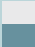
1/2 horizontal 20.5 x 13.3 cm